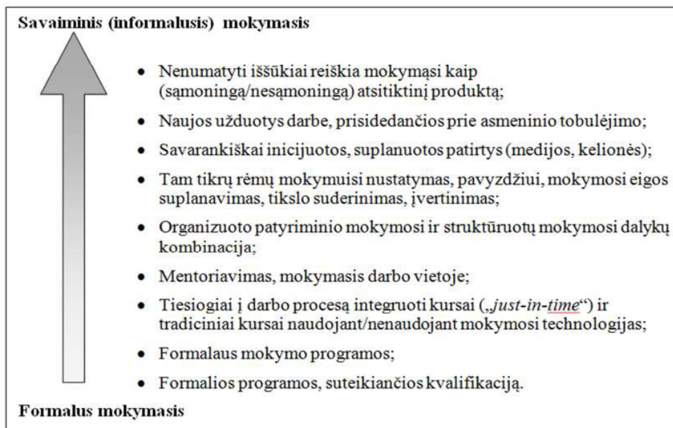
1 pav. Mokymosi skalė pagal Sommerlad ir Stern (1999) 17

Sommerland ir Stern (1999) sudarė skalę, apimančią laipsninį perėjimą nuo savaiminio (informaliojo), neformalaus iki formalaus mokymosi. Šios skalės viršutinė dalis rodo „gryną“ savaiminį (informalų) mokymąsi, o pabaigoje matomas formalus mokymasis (žr. 1 pav.).