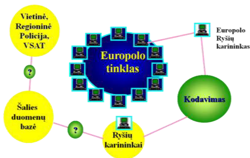
2 pav. Informacijos perdavimo schema

Informacijos rinkimas (2 pav.) vyksta regioniniu lygiu tiek policijoje, tiek Valstybės sienos apsaugos tarnyboje bei kitur, informacijos patalpinimas į duomenų nacionalines bazes bei nacionalinio ryšių karininko informacijos šifravimas ir perdavimas atsakingam Europolo pareigūnui iki tol, kol visa minėta informacija yra įvedama į duomenų bazę.