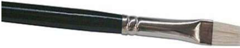
2 pav. Kiaulės šerių teptukas

Bėgant laikui, nepriklausomai nuo to, kokioje aplinkoje būna lavonas, formuojasi odos klostės. Pradinėse klosčių formavimosi stadijose kokybiškam daktiloskopavimui į poodį galima sušvirkšti skysčių arba tiesiog oro burbulą.