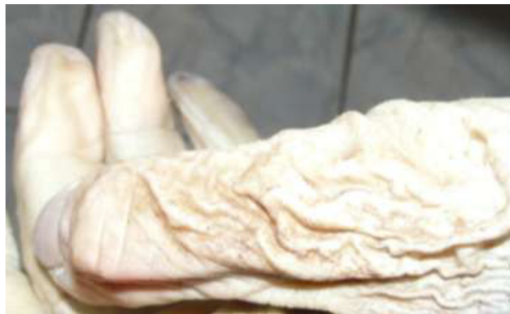
5 pav. Atsisluoksniavusi pirštų oda

– jei lavonas būna drėgnoje, nevedinamoje aplinkoje, tai pirštų oda išlieka drėgna, iš dalies elastinga. Po kurio laiko ji atsidalija nuo minkštųjų audinių. Tokiu būdu dažniausiai pasikeičia pūvančių lavonų ir skenduolių pirštų galai.