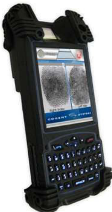
1 pav. Prietaisas Mobile Ident 3