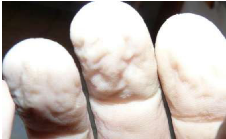
3 pav. Pradinė klosčių formavimosi stadija

Bėgant laikui, nepriklausomai nuo to, kokioje aplinkoje būna lavonas, formuojasi odos klostės. Pradinėse klosčių formavimosi stadijose kokybiškam daktiloskopavimui į poodį galima sušvirkšti skysčių arba tiesiog oro burbulą.