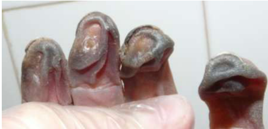
4 pav. Sukietėjusi pirštų oda klostėmis

– jei lavonas buvo vėdinamoje patalpoje, pirštų galai, palyginus su visu kūnu, labai greitai džiušta. Po tam tikro laiko pirštų galų oda suragėja, tampa kieta ir, tik nuplovus pirštus šiltu vandeniu, nepasidaro tinkama skenavimui.