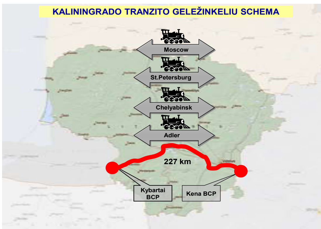
1 pav. Kaliningrado tranzito geležinkeliu schema

Tranzito traukiniu maršrutas eina per teritorijas, kurias prižiūri Vilniaus rajono, Trakų rajono, Elektrėnų rajono, Kaišiadorių rajono, Kauno rajono, Prienų rajono, Kazlų Rūdos, Vilkaviškio rajono, Vilniaus miesto, Kauno miesto, Marijampolės miesto policijos komisariatai (1 pav.).