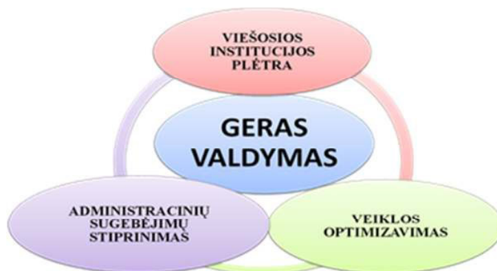
2 pav. Gero valdymo veiksniai (sudaryta pagal Viešosios politikos ir vadybos instituto atstovus, 2013)

Atlikus mokslinės literatūros 16 ir tarptautinės konferencijos "Į rezultatus orientuoto valdymo reformos: ar jau turime naują viešojo valdymo kokybę?" 17 medžiagą, buvo identifikuoti anksčiau minėtų pagrindinių gero valdymo veiksnių požymiai: