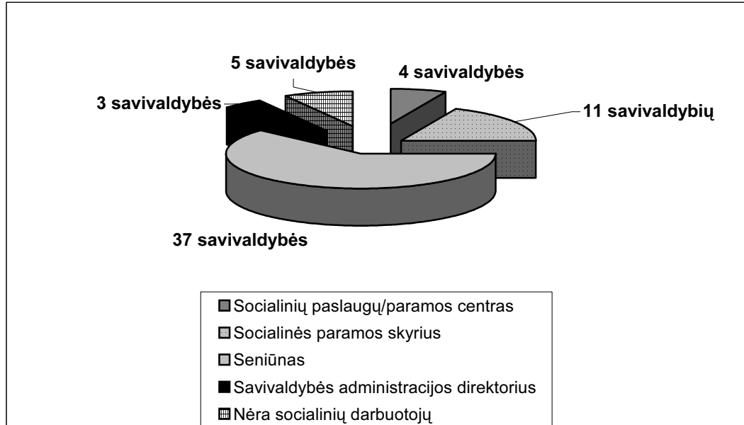
2 diagrama. Seniūnijų socialinių darbuotojų pavaldumas (savivaldybėse)

Socialinių darbuotojų pavaldumas įvairiose savivaldybėse nevienodas. Socialinio darbo organizatoriai seniūnijose (seniūnijose jų darbo vieta) pavaldūs savivaldybės administracijos direktoriams, socialinės paramos skyriams, seniūnams, socialinių paslaugų centrams (2 diagrama).