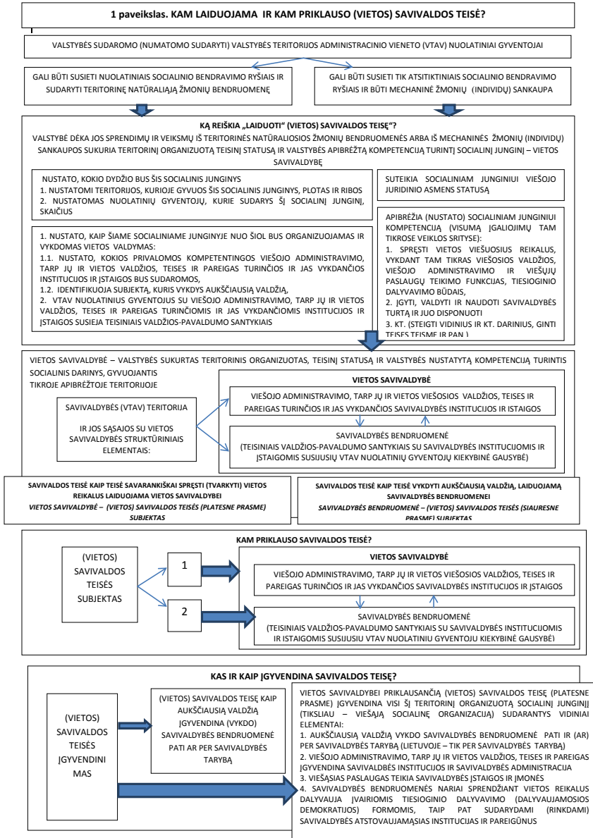
1 pav. Kam laiduojama ir kam priklauso (vietos) savivaldos teisė?