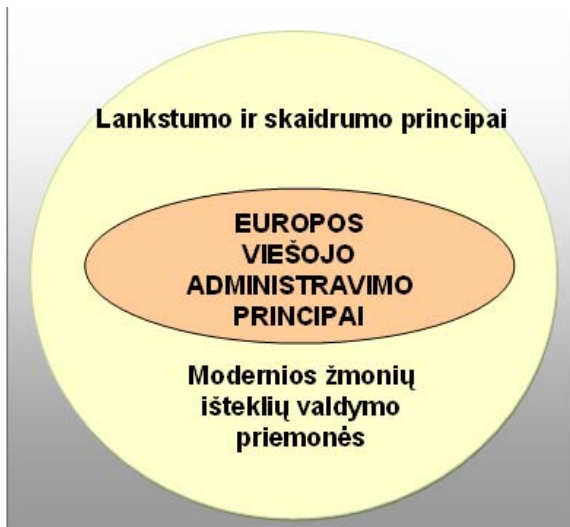
3 pav. Nuosaikus vadybinis valstybės tarnybos reformos modelis

detaliai reglamentuotas, daugiau lankstumo galimybių numatant esamam valdžios įstaigų personalui valdyti [6, p. 56-57].