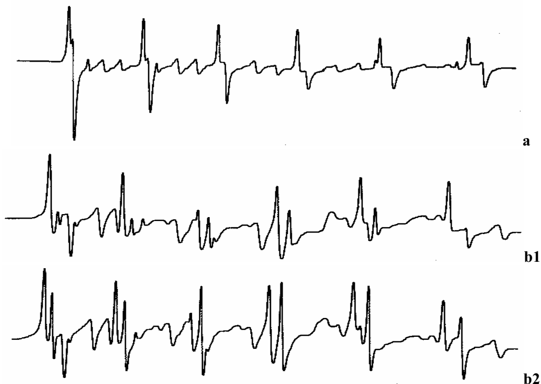
3 pav. Klinčių (a) ir dolomitų (b1 ir b2) EPR spektrai skiriasi. Čia jie parodyti beveik vienodų amplitudžių. Tikrovėje jos gali skirtis keletą kartų. Tai labai palengvina akmens skeveldros atpažinimą. Tyrimui užtenka 5–20 mg masės atplaišos.

Ištyrus didesnių objektų skaičių iš įvairių telkinių nustatyta, kad jų spektrai skiriasi, t. y. pagal divalentį manganą vienas dolomitas nelygus kitam dolomitui, o klintis klinčiai. Skirtingų akmenų skeveldros pagal paramagnetizmą, kaip nustatėme, gali skirtis net 10–15 kartų. Taigi geocheminiame katile kalcitai buvo „išvirti“ su didelėse ribose besikeičiančiais divalenčio mangano jonų kiekiais. Įterpti divalenčio mangano jonai taip ir lieka ilgam laikui. Tad EPR tyrimas leidžia greitai atsakyti, nuo kurio akmens yra atskilusi rasta skeveldra.