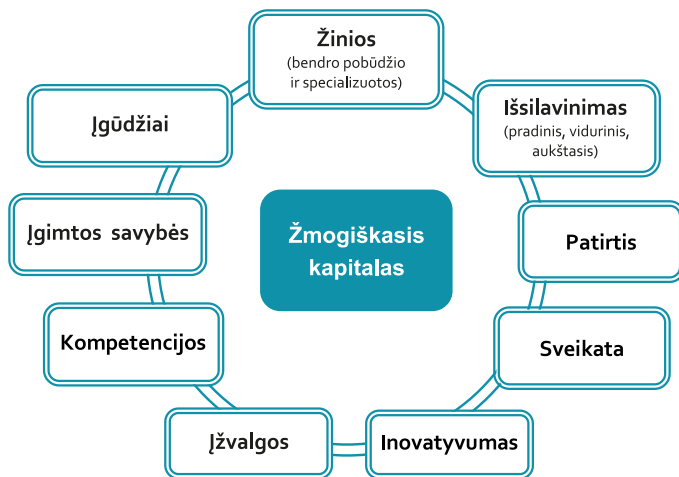
1 pav. Žmogiškojo kapitalo elementai

Apibendrinant galima teigti, kad nors mokslininkai vartojo ir vartoja skirtingas žmogiškojo kapitalo sąvokas, tačiau pagrindiniai sąvokos žmogiškasis kapitalas turinio komponentai yra bendri – tai žinios, asmeninės / įgimtos savybės, įgyti įgūdžiai ir sugebėjimai, išsilavinimas, patirtis, kompetencijos, emocinė ir psichinė sveikatos būklė ir pan.